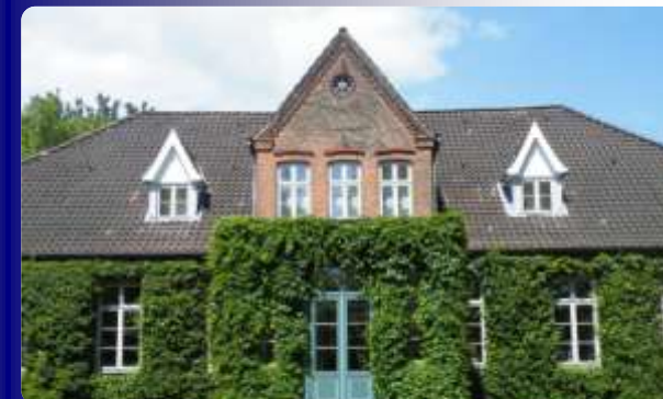
Villa von Issendorff in Himmelpforten